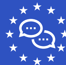
Kiberdrošības kompetenču kopiena