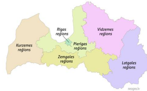
Latvijas statistisko reģionu karte